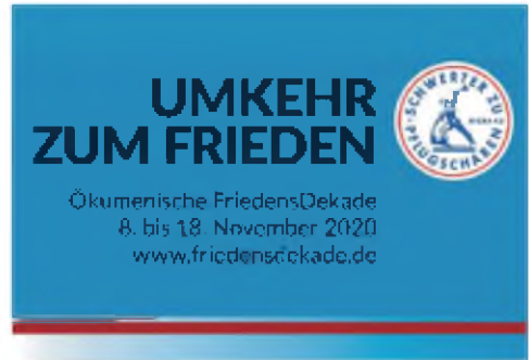
Bild: Logo_ökum Friedensdekade 2020KT