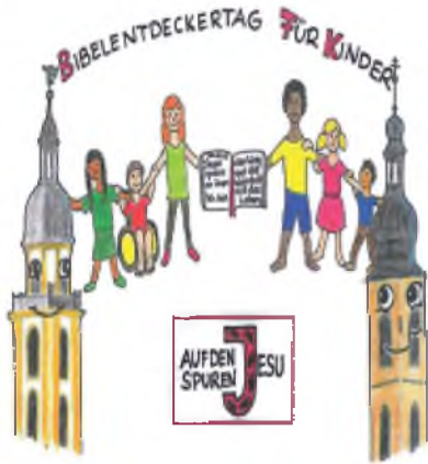
Bild: ökum. Kinderbibelenntdeckertag