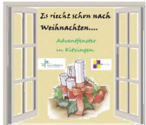
Bild: Logo Adventsfenster