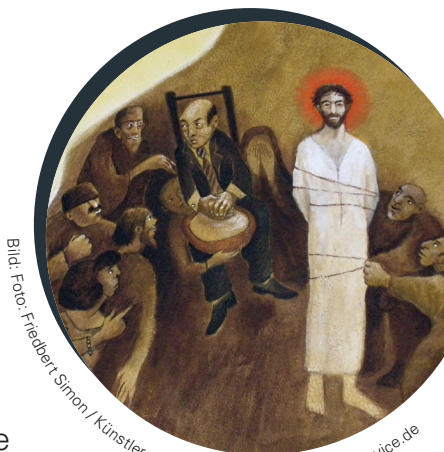
Bild: Foto: Friedbert Simon / Künstler: Polykarp Ünlein in: Pfarrbriefservice.de

Jesus wurde verurteilt und gefesselt. Als Zeichen für die Dornenkrone und die Fesseln, die Jesus angelegt wurden, legen wir eine Schnur zu unserer Kerze und zu unserem Kreuz.