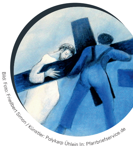
Bild: Foto: Friedbert Simon / Künstler: Polykarp Uehlein In: Pfarrbriefservice.de

Gott, ich bitte für Kinder und Erwachsene, die einsam sind, weil sie keine Freunde und keine Familie haben und für alle, die sich zurückziehen und alle Kontakte abbrechen.