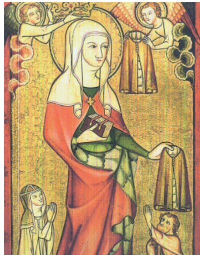
© Joachim Schäfer - Elisabeth als Mantelspenderin, um 1330/50