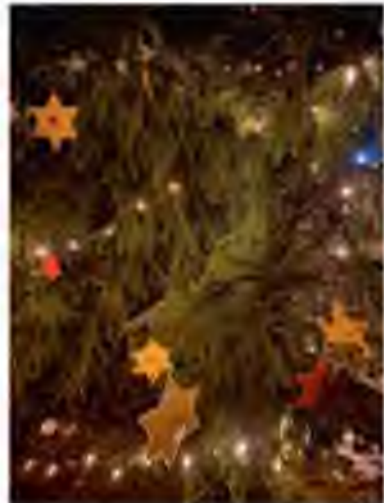
Text u. Bild: Thomas Kram

Gott schloss mit Abram einen Bund. Er ist auch heute noch wirksam, wenn wir uns selbst einzeln und persönlich davon angesprochen fühlen.