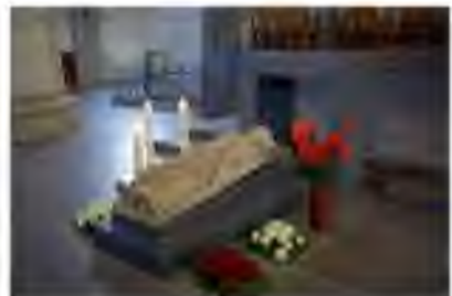
Text: heiligenlexikon.de

In der Liturgie der Kirche hat der Tag des Apostels Matthias den Rang eines Festes, wie alle Gedenktage der Apostel. Aufgrund seines Martyriums, also seines Blutzugnisses für Jesus Christus, ist die liturgische Farbe an seinem Fest rot.