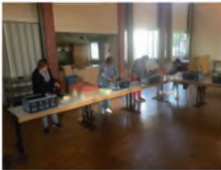
Abpackaktion im Dekanatszentrum