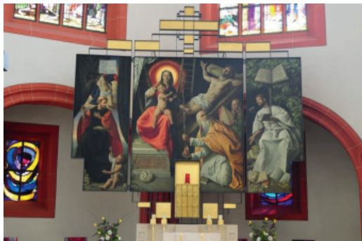
Innenansicht Altarbild Stadt- pfarrkirche Dettelbach